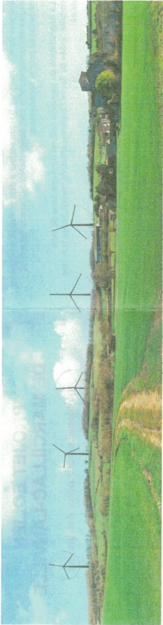
Illustration 1: Covisibilité: impact visuel fort